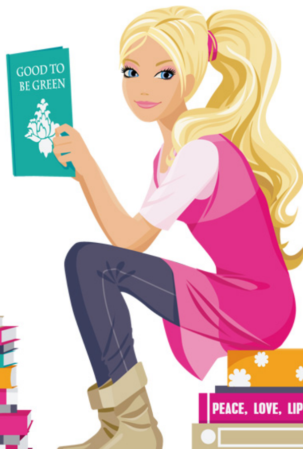
Illustration by buysellgraphic.com

「自分はちゃんと書ける！」 そんな自信がある人こそ 気をつけてほしいトピックが 満載です！